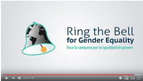
Video conmemorativo del 8 de marzo (2017) "Las Mujeres en el cambiante mundo del trabajo"